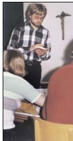
Der große Moment mit dem roten Büchlein: Notenvergabe.

wortungsvoll Informationen zu recherchieren. „Es ist doch phänomenal, was uns dort zur Verfügung steht.“ Und wenn seine Schüler das Internet zum Schummeln einsetzten,